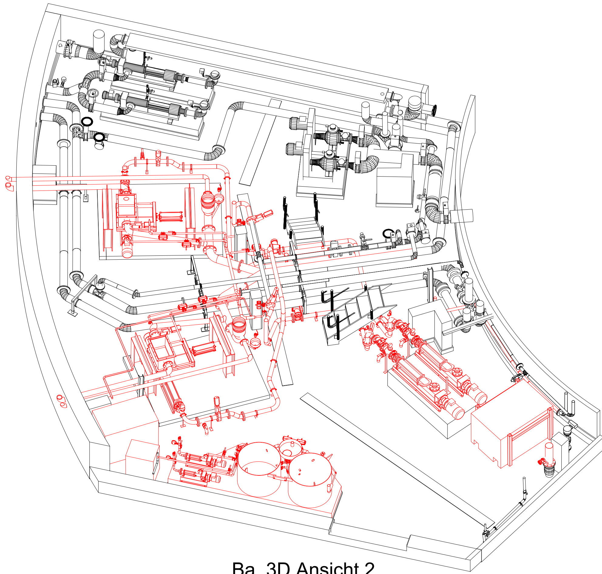
Ba, 3D Ansicht 2